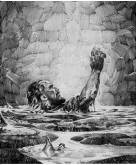
යෙරුමියා මඩ ලිඳකට දැමීම (යෙරුමියා 38 : 6). චිත්‍රය : කෙන් ටනල් විසිනි.

“ඔබ තව ස්වල්ප කලකට විවිධාකාර පරීක්ෂාවලින් පීඩා කරනු ලැබිය යුතු නමුත්, ඒ ගැලවීම ගැන ඔබ ඉතා ප්‍රීති වන්නනු ය” යනුවෙන් ජේදුරුතුමා ලිවිය (1 ජේතිස් 1:6). බොහෝ කිතුනු නොවන අය, ඇතැම් විට කිතුනුවෝ පවා, මෙම පීඩාවේ සහ ප්‍රීතියේ සංයෝජනය පිළිබඳ විශ්මයට පත් වෙති. අපි පීඩා විඳින විට ප්‍රීති වන්නේ කෙසේ ද? ඇත්තෙන්ම, අපට පීඩා ඇති නිසා අපි ප්‍රීති වන්නේ නැත (පීඩා විඳීමේ කිසිම යහපතක් නැත). එහෙත් පීඩාව තිබිය දී පවා අපි ප්‍රීති වන්නෙමු. එය සිදු වන්නේ කෙසේ ද?